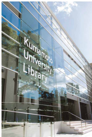
熊本大学附属図書館