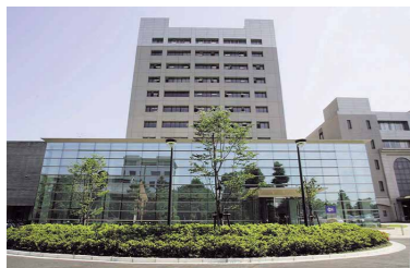
工学部百周年記念館